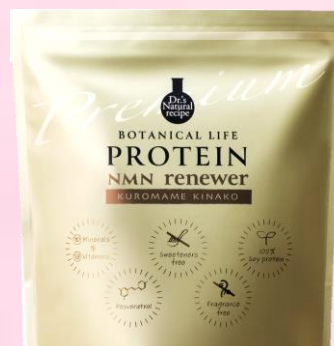
NMNリニューア(黒豆きなこ味)

近年注目されているNMNの他、19種類のスーパーフードや乳酸菌を配合した、健康で若々しくいたい女性のためのプロテイン。