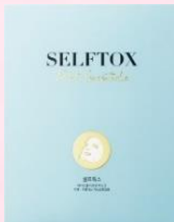
SELFTOXフェイスマスク 1箱(3枚入り)