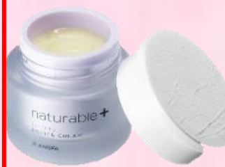
ナチュラルプラス レシピクリーム リフティング

税込12,100円のところ 院内特別価格 税込 9,070円 (税抜 8,245円)