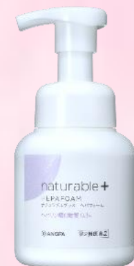
ナチュラブルプラス ヘパフォーム

税込4,500円のところ 院内特別価格 税込 3,710円 (税抜 3,373円)