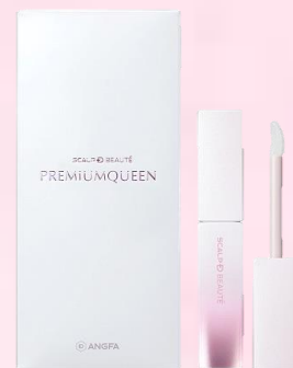
ピュアフリーアイラッシュ プレミアムクイーン

税込8,800円のところ 院内特別価格 税込 6,600円 (税抜 6,000円)