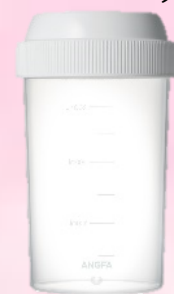
ヘアメディカルプロテイン シェイカー