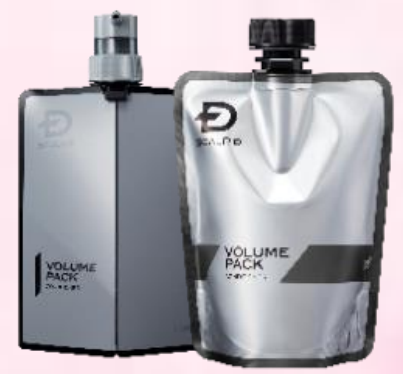
薬用スカルプ パックコンディショナー