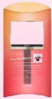
ピュアフリーマスカラ

まつ毛美容液の成分が配合のためメイクするほど美まつ毛にも嬉しい点。お湯で簡単オフできるのも嬉しい点。