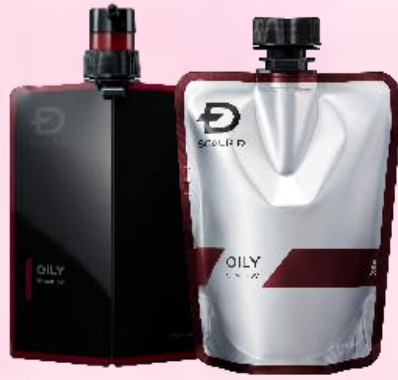
オイリー[脂性肌用]