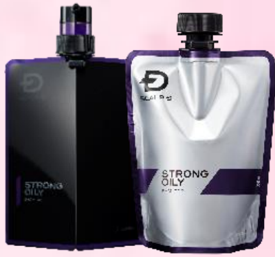
ストロングオイリー [超脂性肌用]