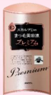
ピュアフリーアイラッシュ プレミアム

税込3,524円のところ 院内特別価格 税込 2,970円 (税抜 2,700円)