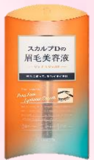
ピュアフリーアイブロウセラム

眉毛専用の成分を配合。ナノ化したカプセルに成分をギュッと詰め込むことでスッピンでも自信の持てる眉毛へ。