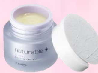
ナチュラブルプラス レシピクリーム リフティング

税込12,100円のところ 院内特別価格 税込 9,070円 (税抜 8,245円)