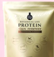
NMNリニューア (黒豆きなこ味)

近年注目されているNMNの他、19種類のスーパーフードや乳酸菌を配合した、健康で若々しい女性のためのプロテイン。