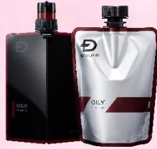
オイリー[脂性肌用]