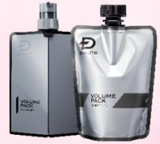
薬用スカルプ バックコンディショナー