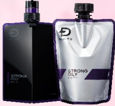
ストロングオイリー [超脂性肌用]