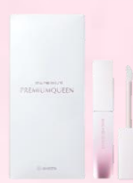
ピュアフリーアイラッシュ プレミアムクween

税込8,800円のところ 院内特別価格 税込 6,600円 (税抜 6,000円)