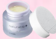
ナチュラルプラス レシビクリーム リフティング

税込12,100円のところ 院内特別価格 税込 9,070円 (税抜 8,245円)