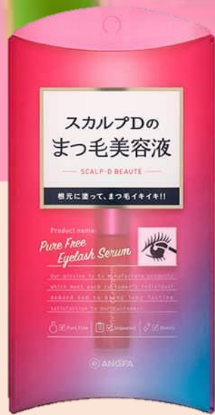
まつ毛美容液 セラム