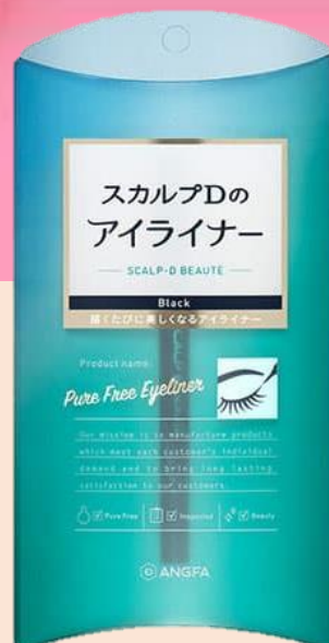
アイライナー (ブラック)