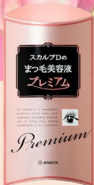
まつ毛美容液 プレミアム