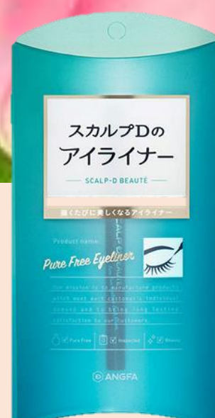
アイライナー (ブラウン)